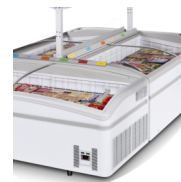
Installation en îlot, tablettes en option