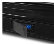
Protection de thermostat