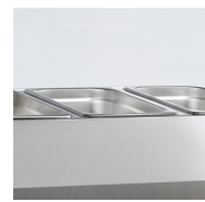
Accepte les bacs GN1/3 (non fournis)