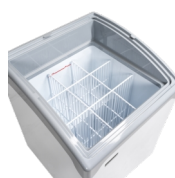
Système de cloisons