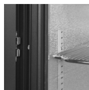
Support de porte pour charger le coffre