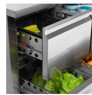
Tiroirs disponibles sous forme de kit séparé