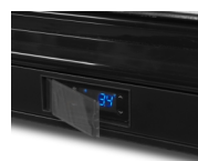
Protection de thermostat