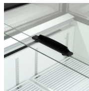
Couvercles vitrés coulissants