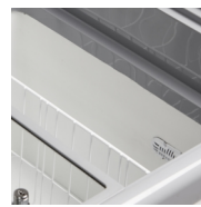
Revêtement interne blanc