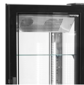
Porte sans cadre