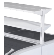
Tablettes promotionnelles en accessoire