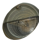
Ventilateur interne et panier