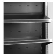
Tablettes réglables avec fonction de basculement