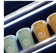
Éclairage LED sous chaque tablette