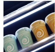
Éclairage LED sous chaque tablette