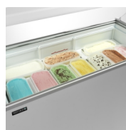
Scooping basket option