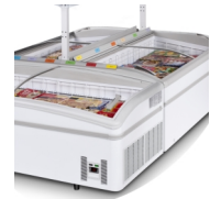
Installation en îlot, tablettes en option