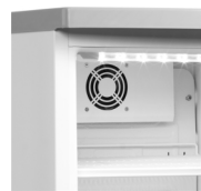
Refroidissement par ventilateur